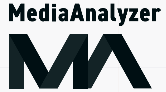
サイズや余白の変更