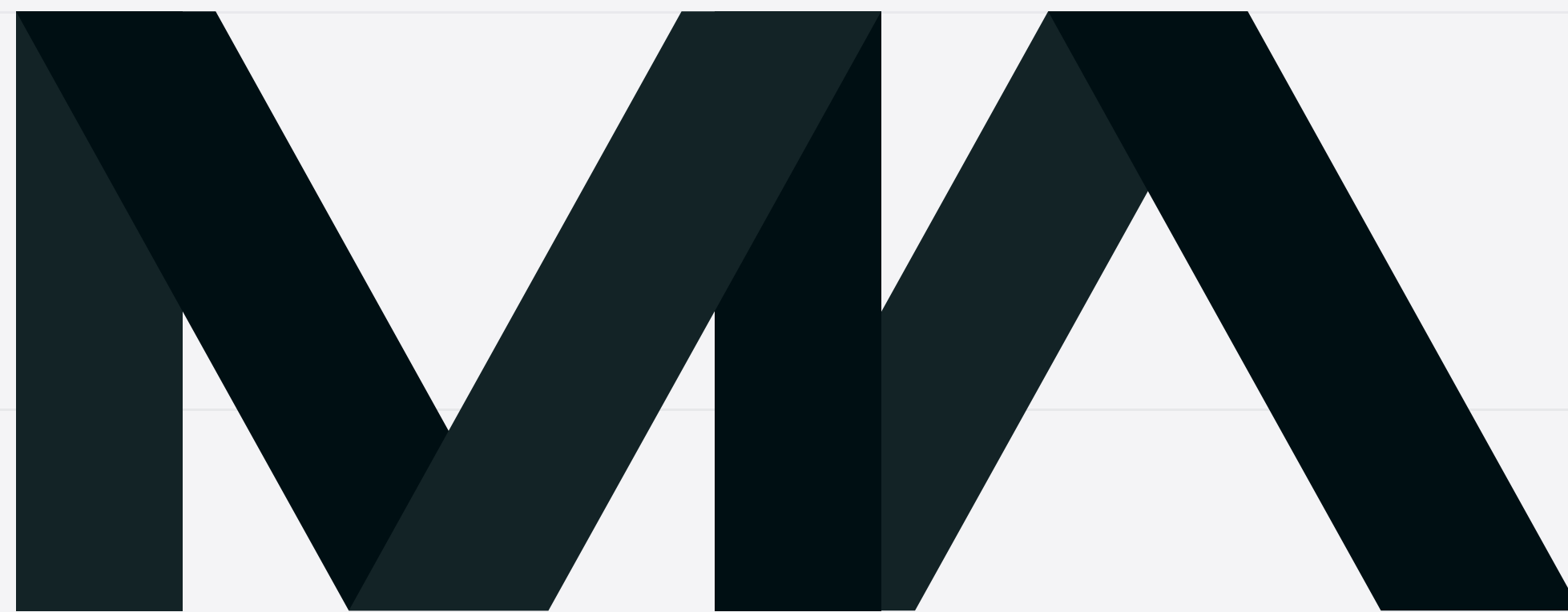
MEDIA ANALYZER LOGO