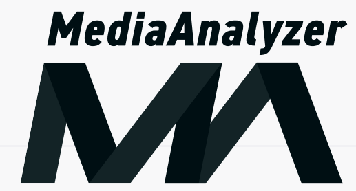
ロゴの変形（長体・平体・斜体等）