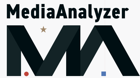
アイソレーション範囲内に他の図形を配置